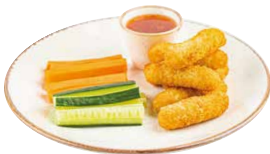
СЫРНЫЕ ПАЛОЧКИ с кисло-сладким соусом