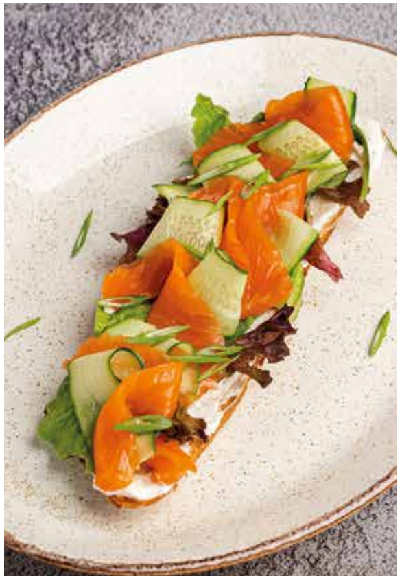
БРУСКЕТТА С ФОРЕЛЬЮ и свежим огурцом