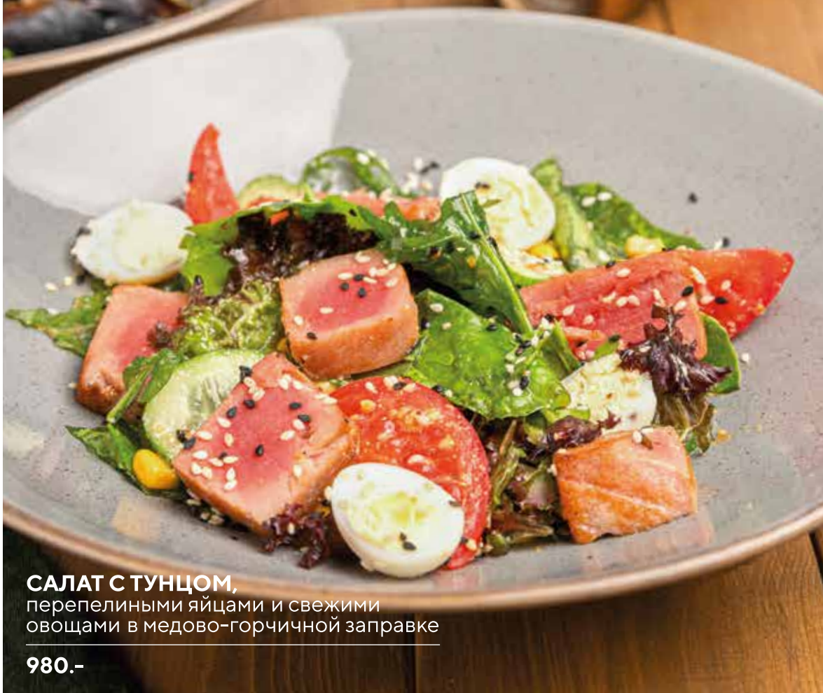
САЛАТ С ТУНЦОМ, перепелиными яйцами и свежими овощами в медово-горчичной заправке