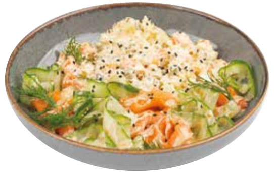
ОЛИВЬЕ С ФОРЕЛЬЮ и домашним майонезом