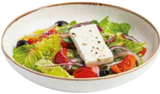
ГРЕЧЕСКИЙ салат с овощами, сыром фета, маслинами и красным луком