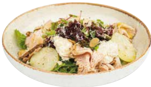
САЛАТ С ПАСТРАМИ ИЗ ИНДЕЙКИ, грушей, горгонзолой и цитрусовым соусом