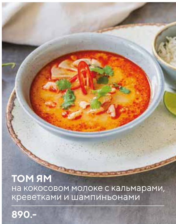
ТОМ ЯМ на кокосовом молоке с кальмарами, креветками и шампиньонами