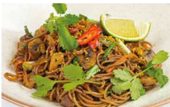
СОБА С КУРИЦЕЙ по-азиатски