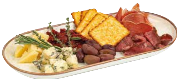
АНТИПАСТИ пармская ветчина, домашний ростбиф, пармезан, горгонзола, маслины каламата, вяленые томаты