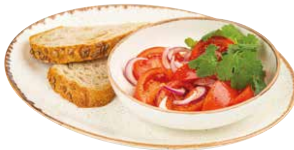
САЛАТ С ТОМАТАМИ, красным луком и ароматным маслом