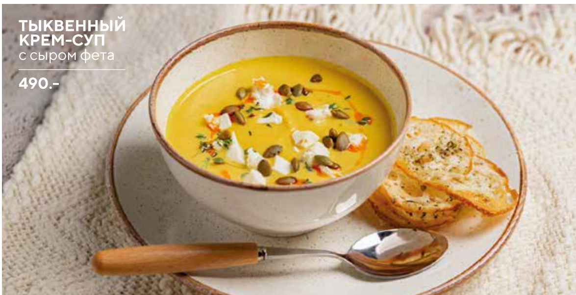
ТЫКВЕННЫЙ КРЕМ-СУП с сыром фета