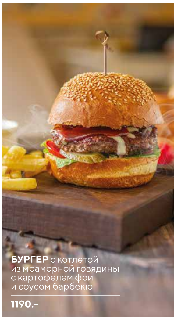
БУРГЕР с котлетой из мраморной говядины с картофелем фри и соусом барбекю