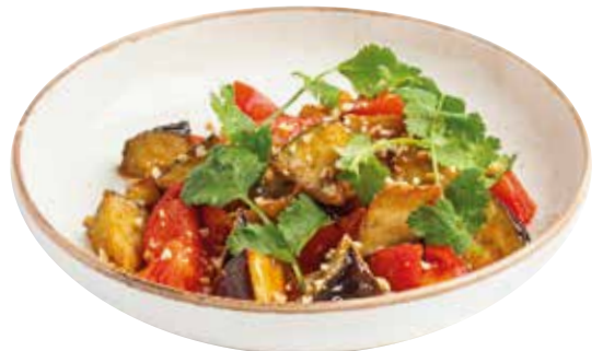
САЛАТ С БАКЛАЖАНАМИ, томатами и жареным арахисом