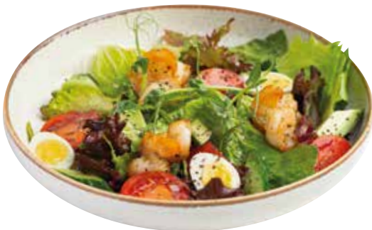
САЛАТ С КРЕВЕТКАМИ и перепелиным яйцом