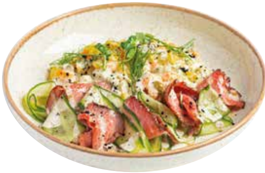
ОЛИВЬЕ С РОСТБИФОМ и домашним майонезом