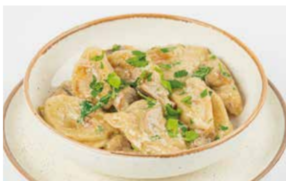
ВАРЕНИКИ С КАРТОФЕЛЕМ И ГРИБАМИ в сливочно-грибном соусе