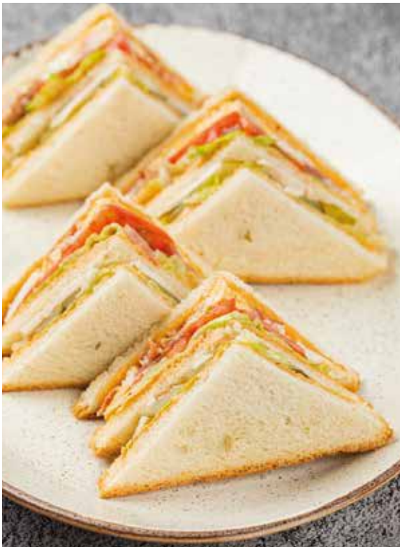
Фирменный СЭНДВИЧ КИТЧЕН с куриной грудкой, яйцом и беконом