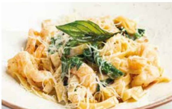
ТАЛЪЯТЕЛЛЕ С КРЕВЕТКАМИ и шпинатом в сливочном соусе