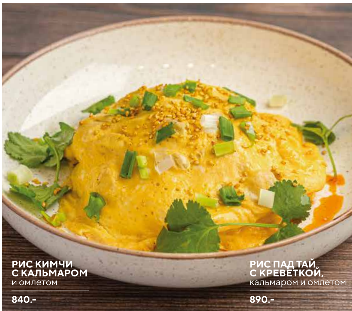
РИС КИМЧИ С КАЛЬМАРОМ и омлетом