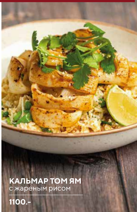
КАЛЬМАР ТОМ ЯМ с жареным рисом