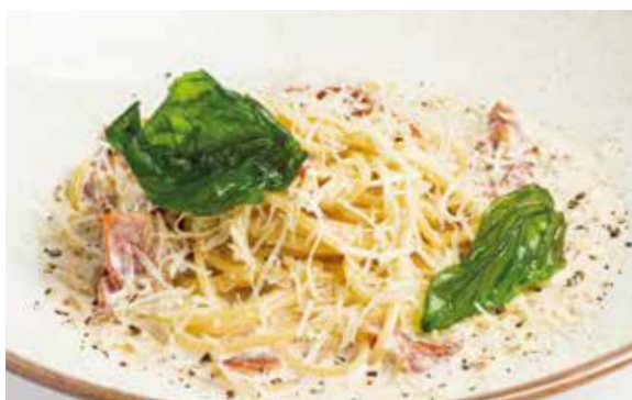
СПАГЕТТИ КАРБОНАРА с луковыми чипсами