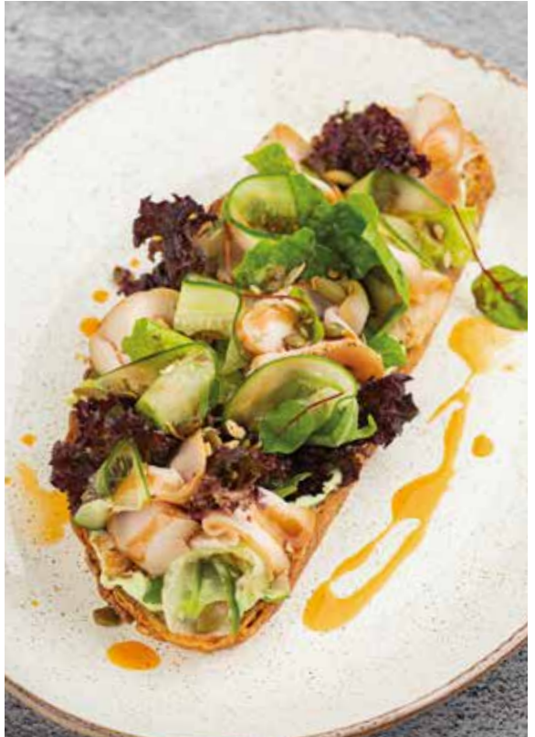
БРУСКЕТТА С ПАСТРАМИ ИЗ ИНДЕЙКИ, огурцом и муссом из авокадо и сливочного сыра