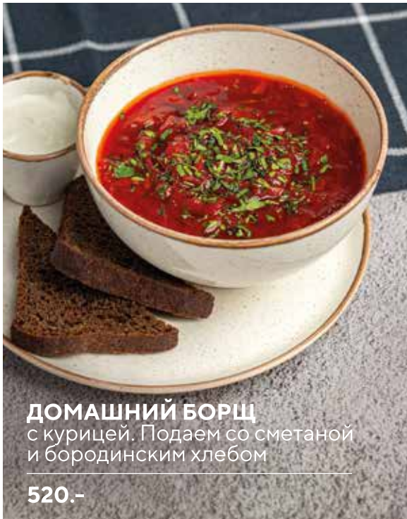
ДОМАШНИЙ БОРЩ с курицей. Подаем со сметаной и бородинским хлебом