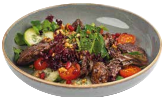
ТЕПЛЫЙ САЛАТ С КУРИНОЙ ПЕЧЕНЬЮ, свежими овощами и гранатом