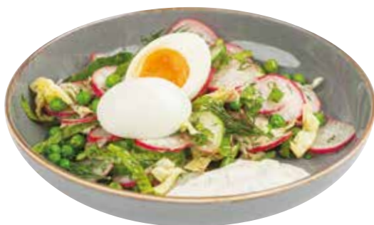
САЛАТ С РЕДИСОМ, огурцом и листьями салата со сметанным соусом