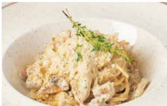
СПАГЕТТИ С КУРИЦЕЙ и грибами