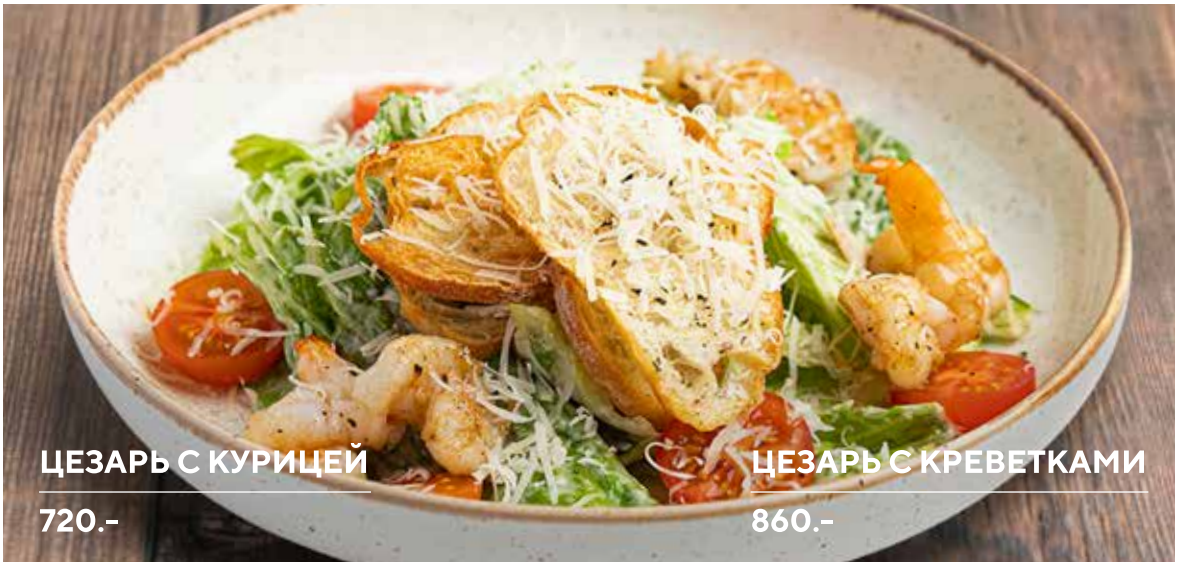
ЦЕЗАРЬ С КУРИЦЕЙ