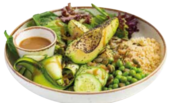
ЗЕЛЕНЬЙ САЛАТ с цитрусовой заправкой