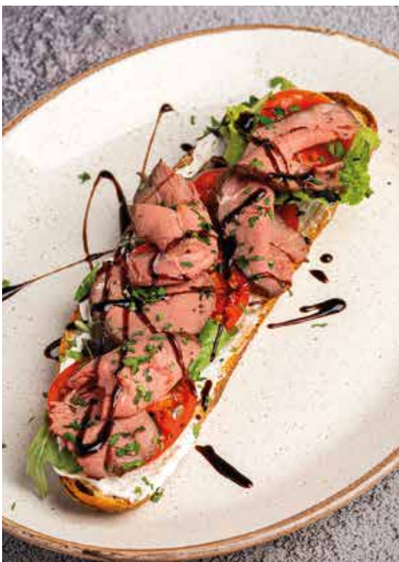
БРУСКЕТТА С РОСТБИФОМ и сочными томатами